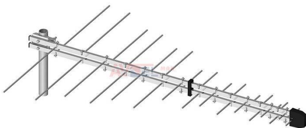
Obr. č. 2. Anténa typu LPDA