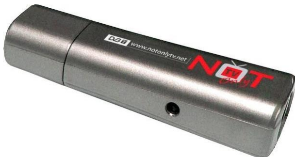
Obr. č. 1. Prijímač RTL-SDR